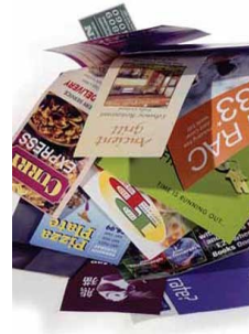
Papel de oficina y Correo no deseado