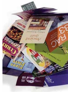
Office paper and junk mail