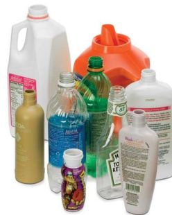
Botellas de plástico, tinas y tapas