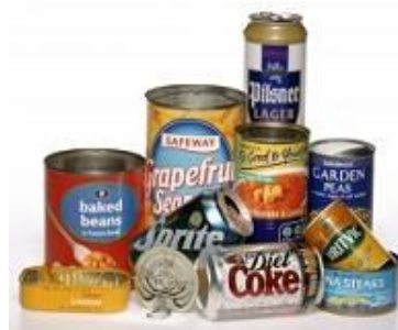
Las latas de metal y utensilios