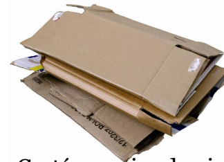
Cartón y cajas de pizza (Sin Residuos de Alimentos)