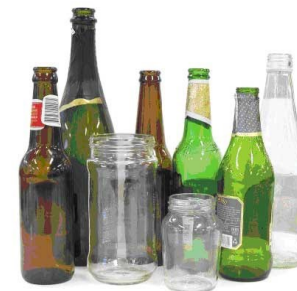
Todas las botellas de vidrio de color