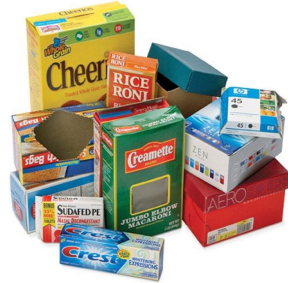
Cartón Nada recubierto en cera