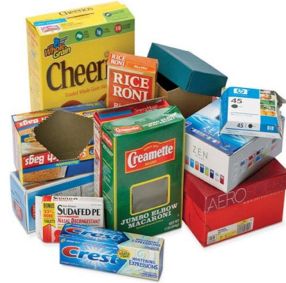
Cartón Nada recubierto en cera