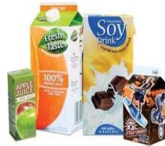
Milk and juice containers Empty and rinsed