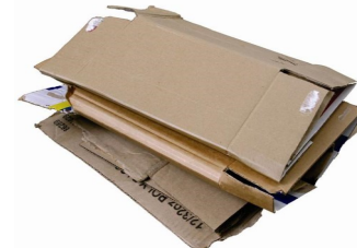
Cardboard and pizza boxes (NO FOOD WASTE)