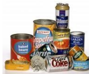
Metal cans and cookware