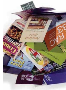
Papel de oficina y Correo no deseado